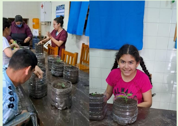
Centro de Día "Meraki" en Presidencia de la Plaza, Argentina